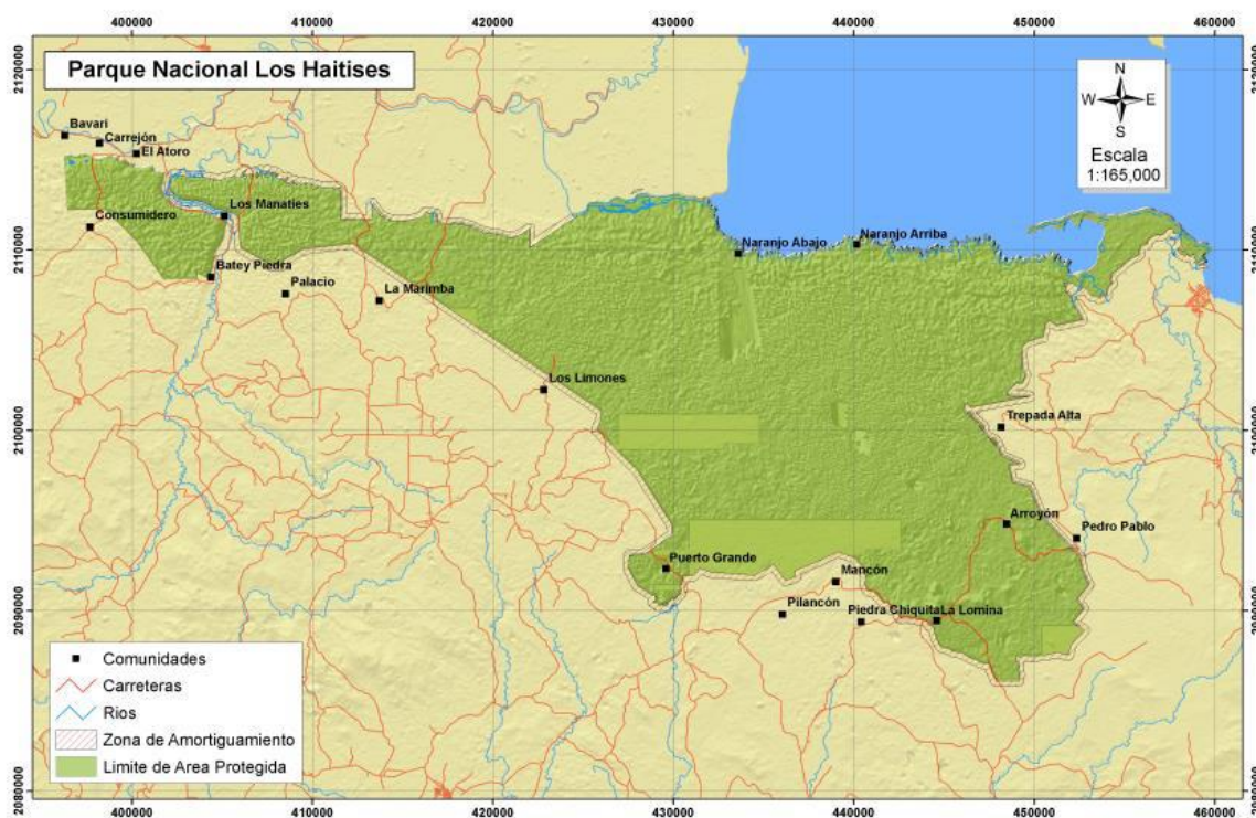
Figura 1. Mapa de Los Haitises con comunidades aledañas tomado del Plan de Manejo 2012-2017 del Parque Nacional Los Haitises (MIMARENA, 2012).

El Parque Nacional Los Haitises se ubica en la zona del país que registra mayor pluviometría. Las temperaturas son cálidas la mayor parte del año, desciende ligeramente en invierno y aumentan en el verano.